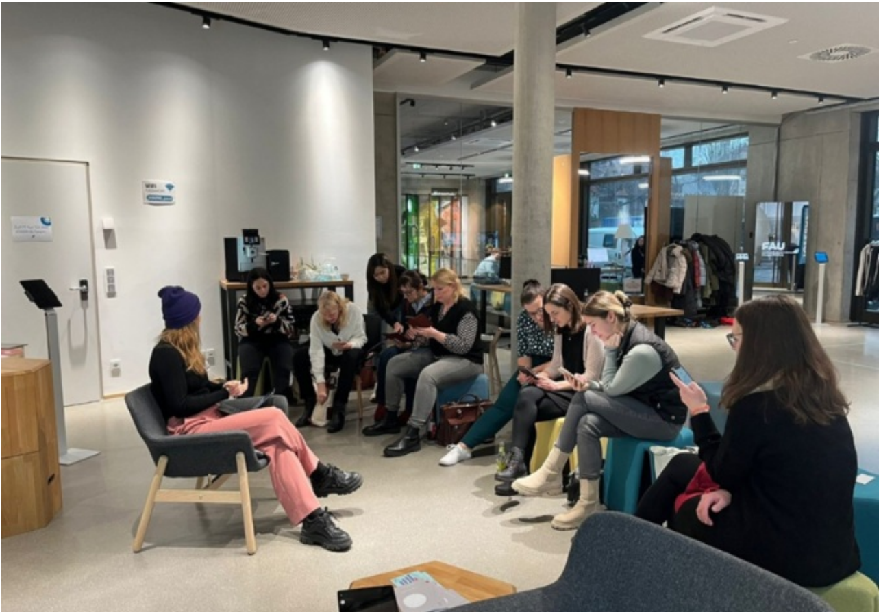
Das Bild zeigt das PPZ-Team während der Testung der Augmented-Reality-App "InnoHikes".

Gemeinsam mit dem JOSEPHS–Team entwickelten wir neue Ideen für die Gegenwart und Zukunft – euch vielen Dank für diesen bereichernden Tag im Innovationsbüro, Ihr leistet tolle Arbeit!